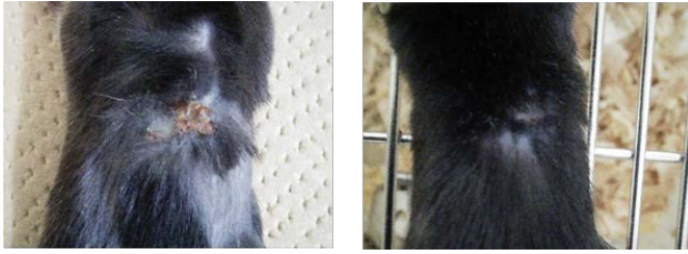
図3. XCR1-DTA のオスマウスの皮膚を XCR1-DTA のメスマウスへ移植。移植後 25 日、マウス 2 匹の移植部位を示す。

トロールのメスマウスに移植した場合には移植皮膚は拒絶され、創傷は治癒した（図2）。そこで、XCR1-DTA のオスマウスの皮膚を XCR1-DTA のメスマウスに移植したところ、図2と同様に、移植皮膚は拒絶され、創傷は治癒した（図3）。XCR1+DC が欠失していても移植皮膚が拒絶されたことから、移植片拒絶反応において、XCR1+DC は必須ではないと考えられた。